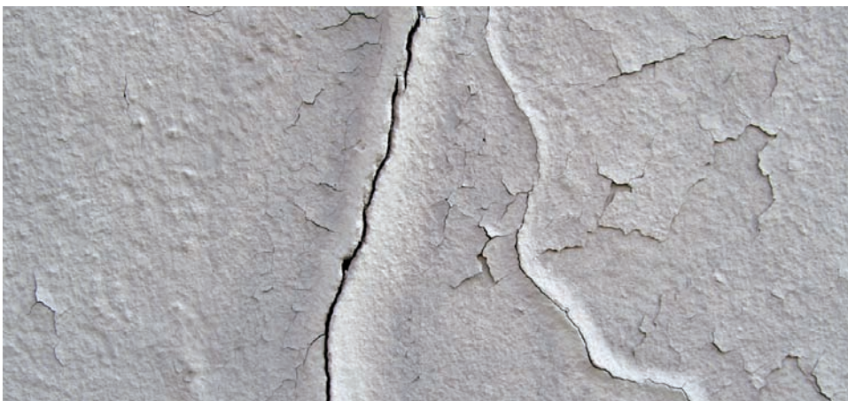
Nach rund vier Jahren oder wenn mehrere Schichten übereinander aufgebracht wurden, beginnt der reversible Graffiti-schutzanstrich abzublättern bzw. auszukreiden. Das Entfernen aller Schichten und Aufbringen eines frischen Schutzanstrichs ist nötig.