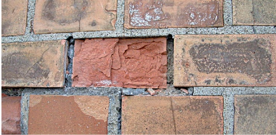
Schadensbild nach Abplatzungen.

Einige Produkte auf Wachsbasis sind in sich zwar nicht hydrophob, es werden jedoch Grundierungen mit hydrophober Wirkung oder Überarbeitungen mit Hydrophobierungen empfohlen. Dabei kommt wieder das oben beschriebene Funktionsprinzip zum Tragen.