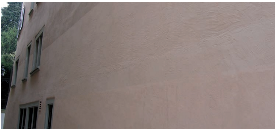
Graffiti-schutzanstriche können beliebig abgetönt werden. In diesem Beispiel wurde der Farbton nicht ideal getroffen.