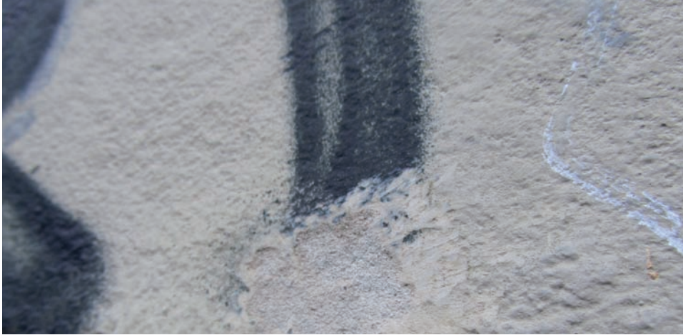
Kalkschlamm lässt sich trocken abbürsten.