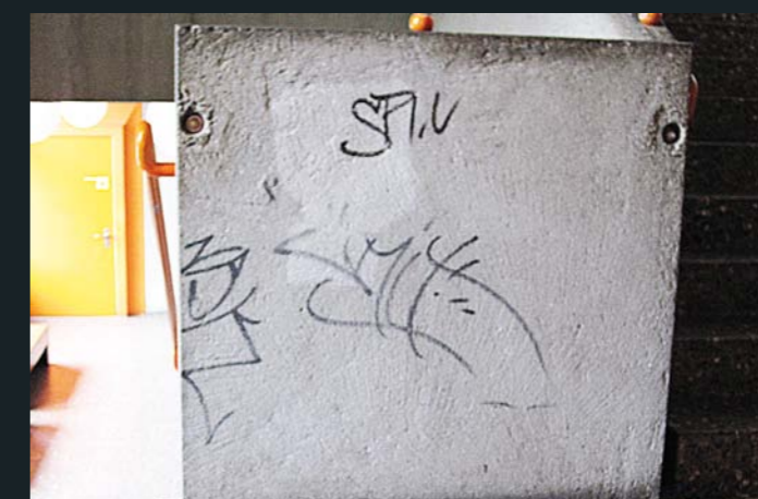
Graffiti, nicht entfernbar