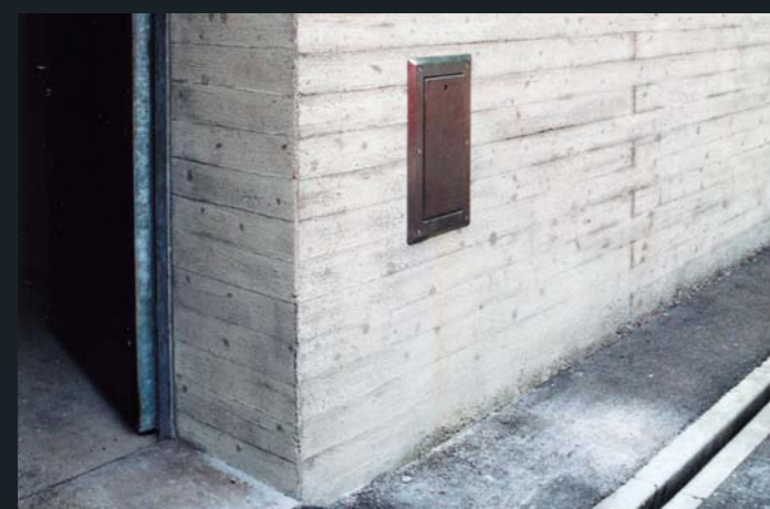
Reprofilieren, partielles Einretuschieren