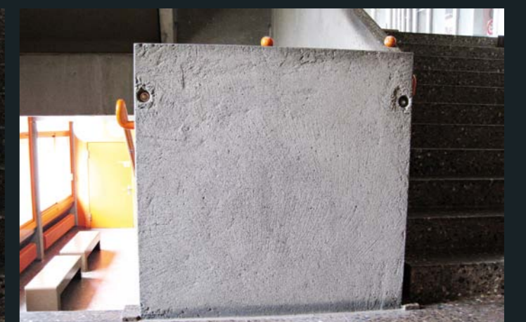
Gewaschen, partiell retuschiert