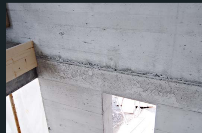
Etappenübergang mit Kiesnestern