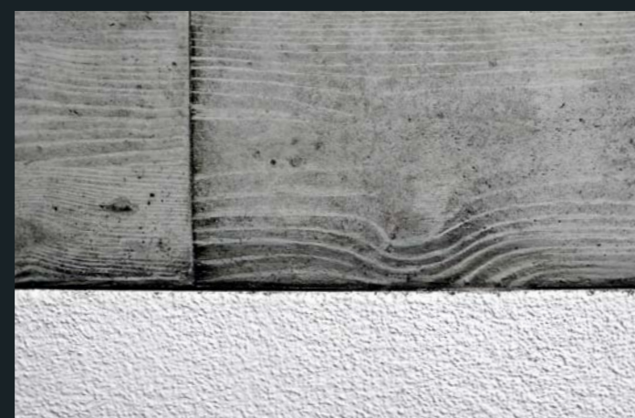
Reprofilieren, partielles Retuschieren