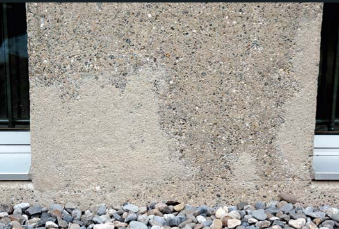
Farbdifferenzen (beim Reprofilieren von gestocktem Beton)