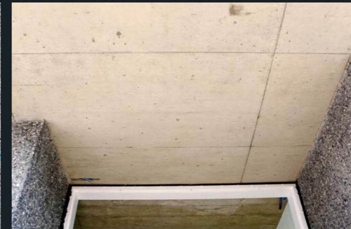
Neue Betonfüllung, partielles Retuschieren