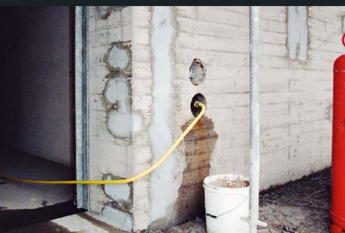
Abplatzungen durch korrodierte Armierung

Nach genauer Analyse vor Ort werden zusammen mit Bauherrschaft und/oder Planer die einzelnen und nötigen Ausführungsschritte bestimmt. Daraufhin erstellen wir eine verbindliche Kostenschätzung und erarbeiten auf Wunsch Musterflächen.