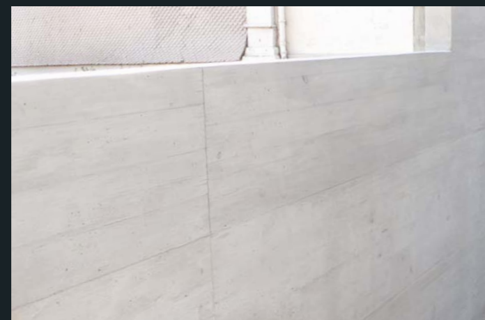
Reprofilieren, Retuschieren, Lasieren