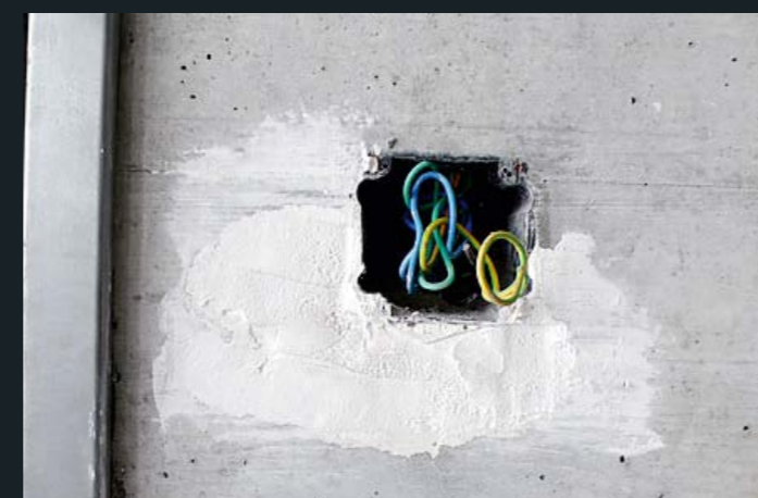
Falsch eingelegter Lichtschalter